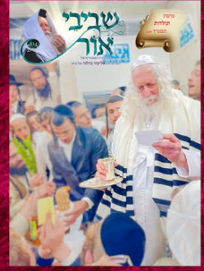
מורינו הרב מוצאי שבת האחרון