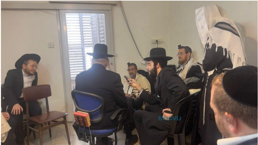
מוריננו הרב בבני ברק בניהום אבלים על פטירת אחות הרבנית תלטי"א