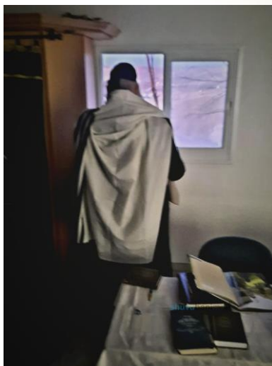
מוריננו הרב בתפילת שחרית במצפה יריחו השבוע

אָדָם חוֹשֵׁב זֶה הַגּוּף שְׁלִי כִּכָּה ה' בְּרָא אוֹתִי, מָה אֲנִי יְכוֹל לַעֲשׂוֹת... ה' לֹא בְּרָא אוֹתָךְ כִּכָּה! ה' בְּרָא אוֹתָךְ עִם גּוּף זָךְ וְטָהוֹר שְׂמֵאִיר יוֹתֵר מִהַשְּׂמֵשׁ, יוֹתֵר מִהַיֵּרָח! וּבְגִלָּל הַחֲטָא אֲזִי הַגּוּף נִהְיָה חֲשׂוֹף, זֶה הַכְּתָנֶת עוֹר שֶׁה' בְּרָא אוֹתָם אַחֲרֵי הַחֲטָא - שְׂאָדָם שְׂמַע לְקוֹל הַנְּחָשׁ. וְכָל מָה שְׂאָדָם שׁוֹמֵעַ שְׁלוּחִשִּׁים לוֹ זֶה הַקוֹל שֶׁל הַנְּחָשׁ, וְהוּא צְרִיף לְהַתְּמוּדָד (אֶת) [עם] זֶה מֵאָה עֲשָׂרִים שָׁנָה.